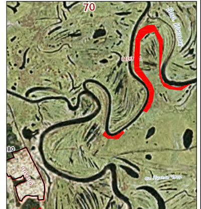
Масштаб 1:100 000